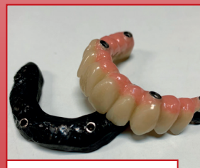
Subestructuras y barra híbridos