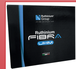
Caja fibra UHM alto módulo