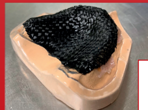
MAT Refuerzo prótesis removable