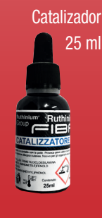
Catalizador 25 ml