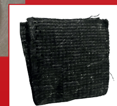
Hoja fibra MAT