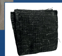
Hoja fibra MAT