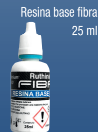
Resina base fibra 25 ml