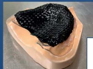
MAT Refuerzo prótesis removable