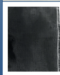
UHM alto módulo