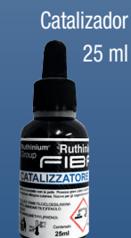
Catalizador 25 ml