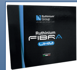
Caja fibra UHM alto módulo