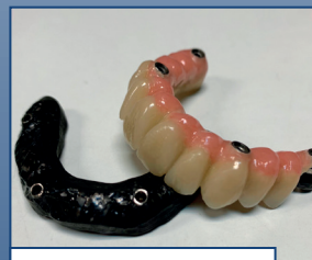
Subestructuras y barra híbridos