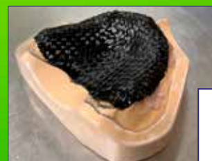
MAT Refuerzo prótesis removible