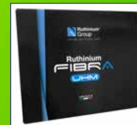
Caja fibra UHM alto módulo