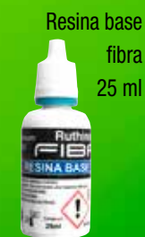
Resina base fibra 25 ml