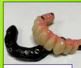
Subestructuras y barra híbridos