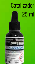
Catalizador 25 ml