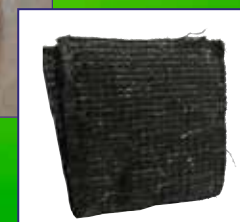
Hoja fibra MAT